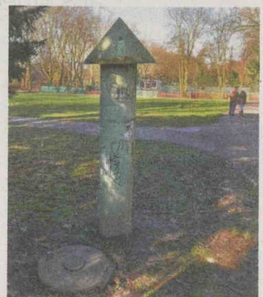
Über diese Anlage nahe der Tennisplätze wurde der Bunker belüftet.