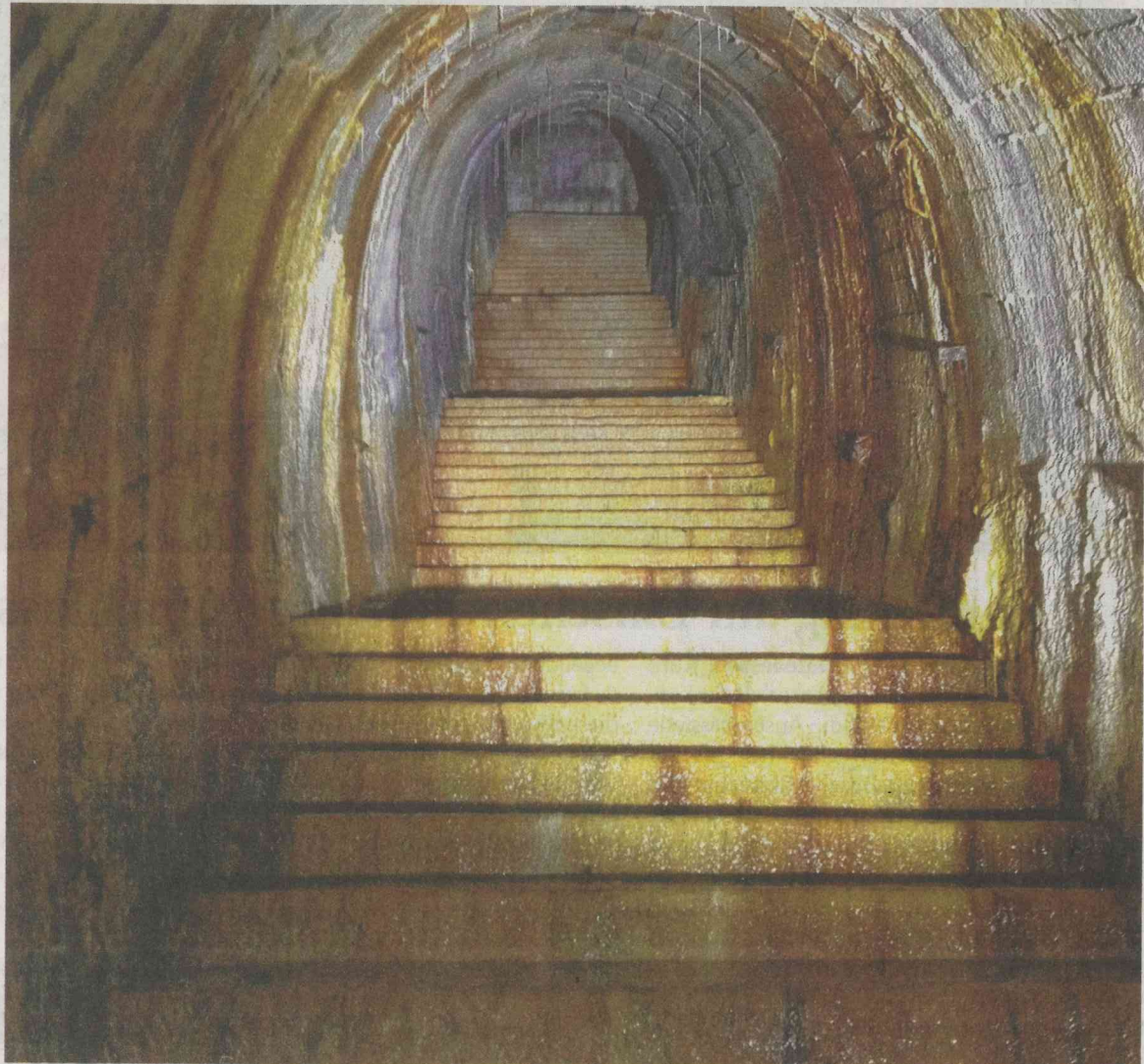
Dieses Bild zeigt den Aufgang zum Haupteingang des Bunkers. Die zunehmende Feuchtigkeit ist anhand der Treppen und der Stalaktiten deutlich zu sehen.

Ab 1943 war die Organisation Todt (OT) für den Ausbau von Luftschutzanlagen für die Zivilbevölkerung verantwortlich. Dabei kamen auch Kriegsgefangene und KZ-Häftlinge zum Einsatz.